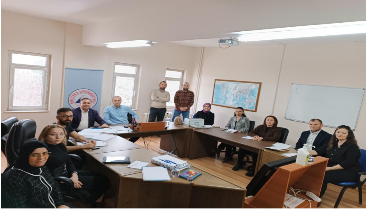
Değerlendirme Takımının Enstitü Kurulu, Yönetim Kurulu Üyeleri ve Enstitü Sekreteri ile görüşmesi (10.30-11.30)