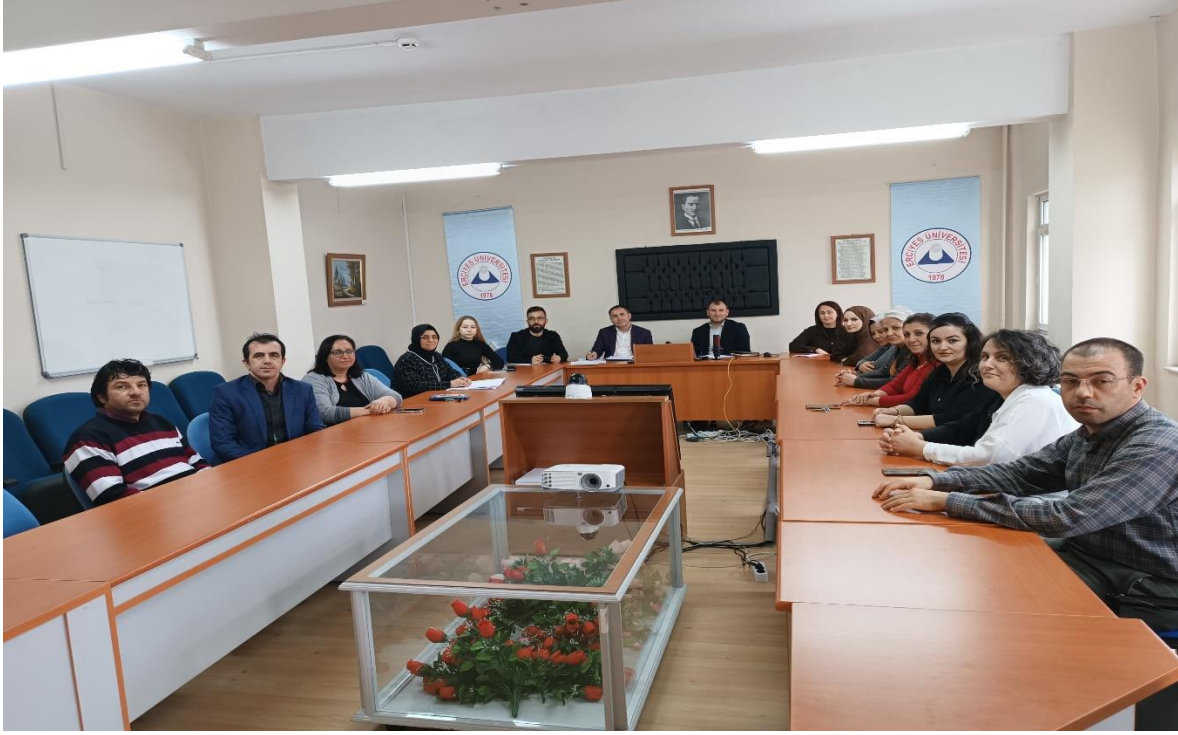
Değerlendirme takımının birimin paydaşlarıyla görüşmesi (16.15-17.00)