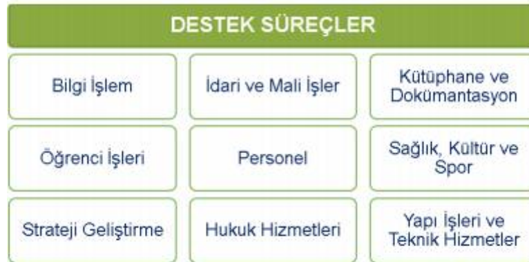
Şekil 4. Erciyes Üniversitesi Destek Süreçleri