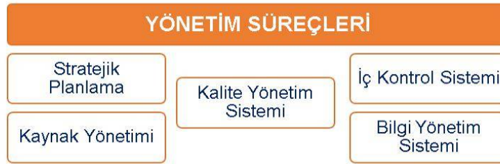
Şekil 2. Erciyes Üniversitesi Yönetim Süreçleri