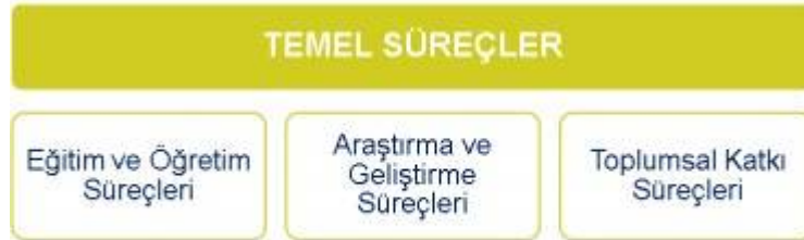
Şekil 3. Erciyes Üniversitesi Temel Süreçleri