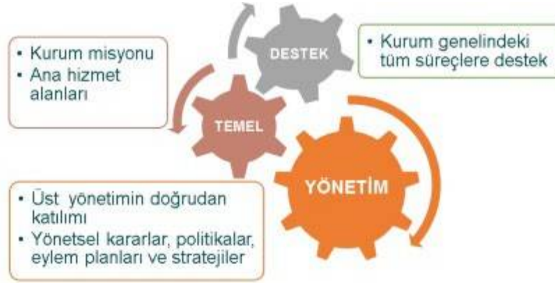
Şekil 1. Erciyes Üniversitesi Süreçleri