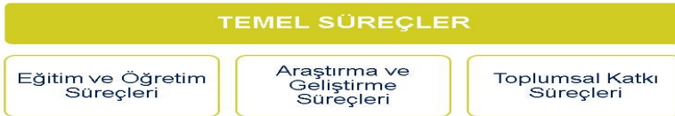
Şekil 3. Erciyes Üniversitesi Temel Süreçleri

Temel süreçler, Üniversitenin misyonunu gerçekleştirmek için faaliyette bulunduğu ana hizmet alanlarıyla ilgili süreçlerdir. Bu süreçler; Eğitim ve Öğretim, Araştırma ve Geliştirme ve Toplumsal Katkı olarak tanımlanmıştır (Şekil 3).