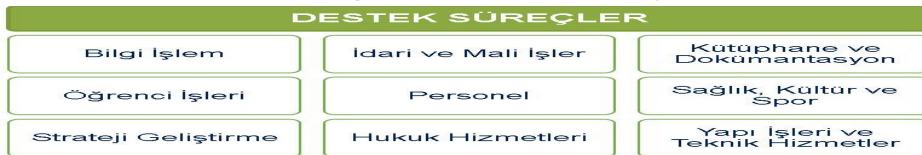
Şekil 4. Erciyes

Destek süreçleri, Üniversite genelindeki bütün faaliyetlere destek veren süreçlerdir (Şekil 4).