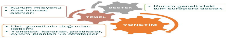
Şekil 1. Erciyes Üniversitesi Süreç Yönetim Yaklaşımı

Erciyes Üniversitesi kurum iş süreçlerinin yönetiminde Risk Tabanlı Süreç Yönetim Sistemini (RTSYS) benimsemiştir. 2018 yılı sonunda başlatılan RTSYS iyileştirme çalışmaları devam etmektedir.