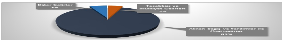
Şekil 7. Üniversite Finansal Kaynaklarının Dağılımı

Finansal kaynakların dağılımı Şekil E.7'de gösterilmiştir. Grafikten de görülebileceği gibi finansal kaynakların %89'u bağış ve yardımlar ile hazine yardımlarından, %11'i ise öz gelirlere (teşebbüs ve mülkiyet gelirleri ve diğer gelirler) oluşmaktadır.