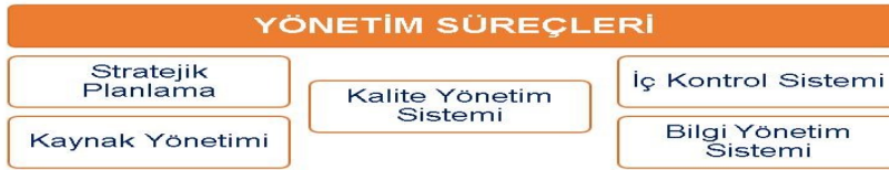
Şekil 2. Erciyes Üniversitesi Yönetim Süreçleri

Erciyes Üniversitesi yönetim süreçleri; Stratejik Planlama, Kalite Yönetim Sistemi, İç Kontrol Sistemi, Kaynak Yönetimi ve Bilgi Yönetim Sistemlerinden oluşmaktadır (Şekil 2).